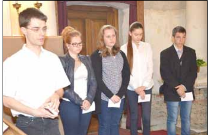
A konfirmandusokat köszöntő ifjúság

leg is. Összejöveteleinket próbáljuk színesebbé tenni egy-egy játékkal, áhítattal, vagy csak vidámsággal. Önszerveződő körként indultunk és nem kértünk fel vezetőt, hiszen úgy gondoljuk, hogy egy nyitott közösség jobba teheti a légkört. A döntéseket megbeszéljük,