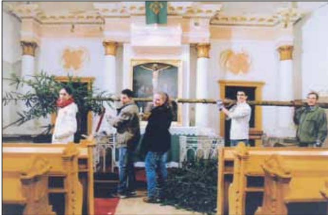
A templomi karácsonyfa bontása