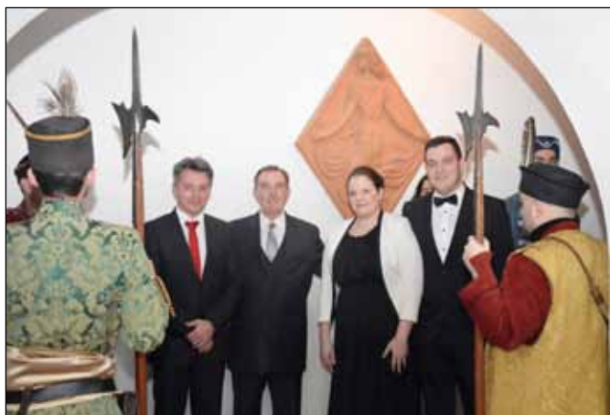
A szlovéniai díszvendégek érkezése