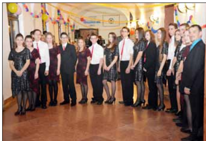
A táncbemutatóra felkészült Konfirmandusok