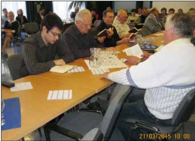
Zsűrizés előtti áhítat, a társadalmi zsűri – énekeskönyvvel

Az együttlét tanulságait és örömét jól fogalmazta meg