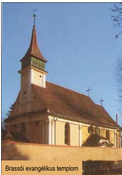
Brassói evangélikus templom

Második nap – csütörtök: este érkezünk meg Brassóba (300 km.) Itt családokhoz leszünk elosztva, a szállást - ellátást ők adnak, kis részben programot is.