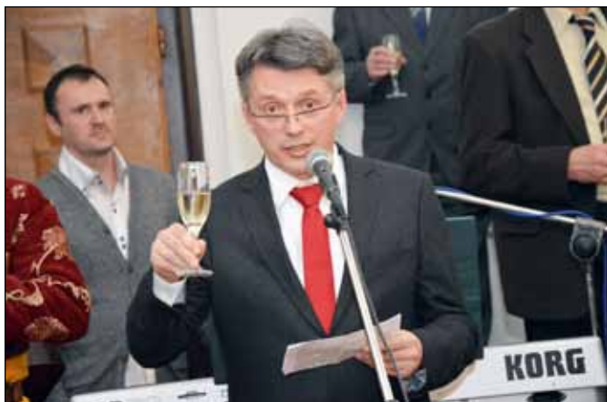
„A Bált ezzel megnyitom”