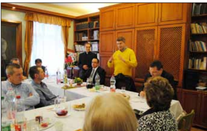
Ágh Péter országgyűlési képviselő köszönti a résztvevőket