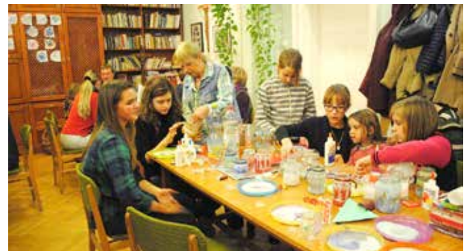
Hittanosaink ádventi kézműves foglalkozása