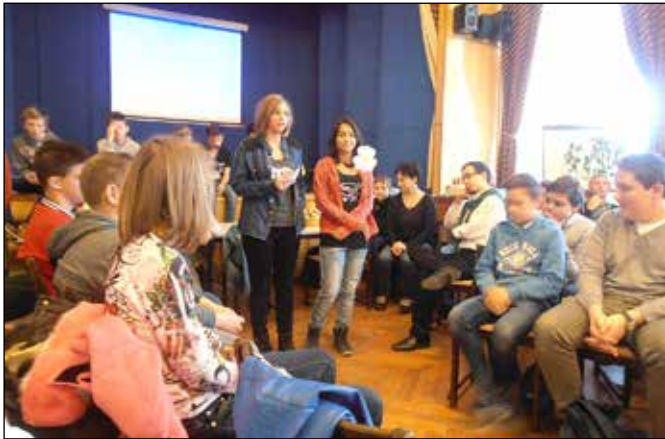
Konfirmandusaink bemutatják gyülekezetüket

November 14.-én szombaton ellátogattunk a konfirmandus napra, amely Kőszegen került megrendezésre. Reggel izgatottan mentünk ki a buszmegállóba, hogy felvegyen minket a külön busz és elvigyen erre a várva-várt napra. A buszban nagyon jó volt a hangulat. A kőszegi mezőgazdasági középiskolában zajlott az egész napos program. Amikor oda értünk, énekelni kezdtünk gitárkísérettel.