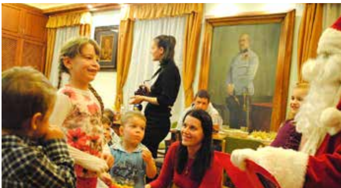
Mikulás érkezett a Baba-Mama Körbe