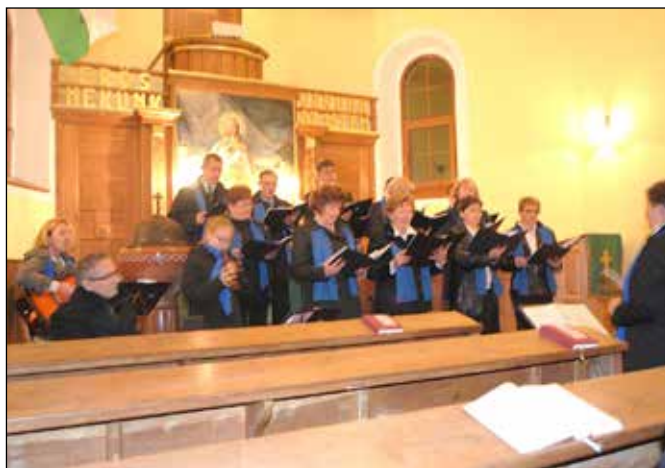
Kortárs Keresztyén Kórus szolgálata Szergényben