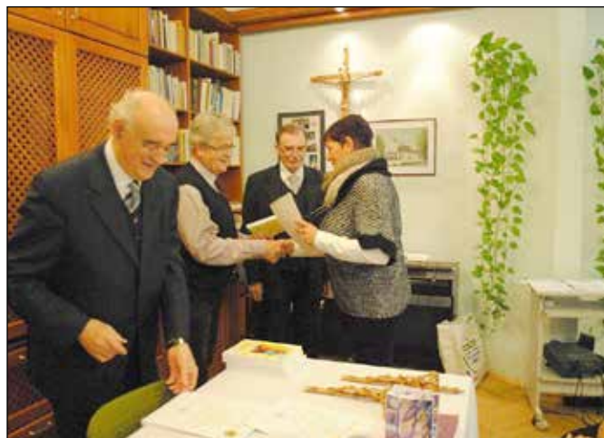
Gyülekezeti munkatársak bizonyítvány osztása

és hívogasson. A gyülekezeti alkalmak előkészítésében lehet fontos és szükséges feladata. A „második típusú” inkább diakóniai lelkülettel van megáldva. Ő az, aki közvetlen segítséget ad. Kitakarít vagy bevásárol a rászorulóknál. A” harmadik típusú” a legösszetettebb és a legnagyobb képzést igényli. Ő már lelki gondozást is végez. Ehhez azonban az adottságon túl képzettségre is szükség van. Németországban, Brémában a Szent Máté gyülekezetben ismertem meg ezt a képzési modellt.