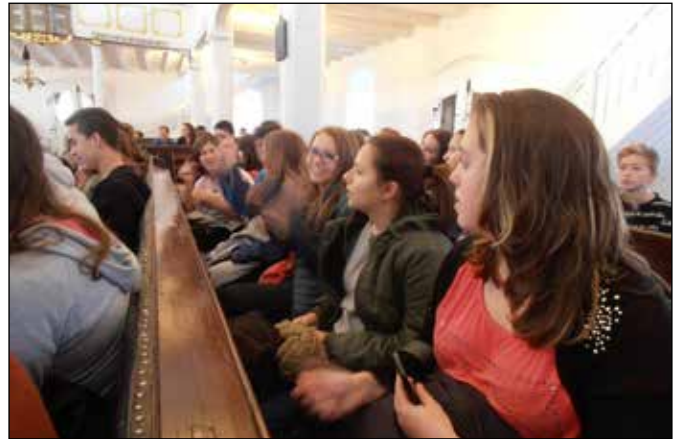
Záró istentiszteleten a kőszegi templomban

Azután ebédelni mentünk. Mindenkinek nagyon ízlett és repetázni is lehetett belőle. Ebéd után felmentünk ismét a gyülekező terembe hogy megtudjuk, mi a harmadik feladat. Az iskolai tanárai közreműködésével különböző foglalkozásokat lehetett választani délutáni