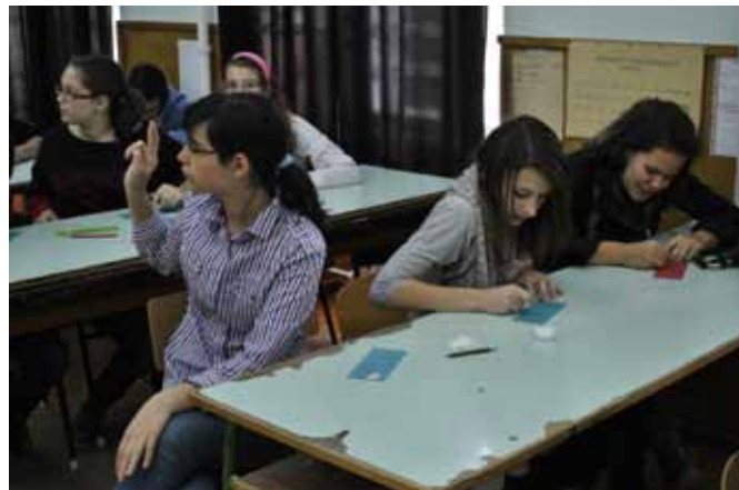
Sárvári lányok a kézműves foglalkozáson