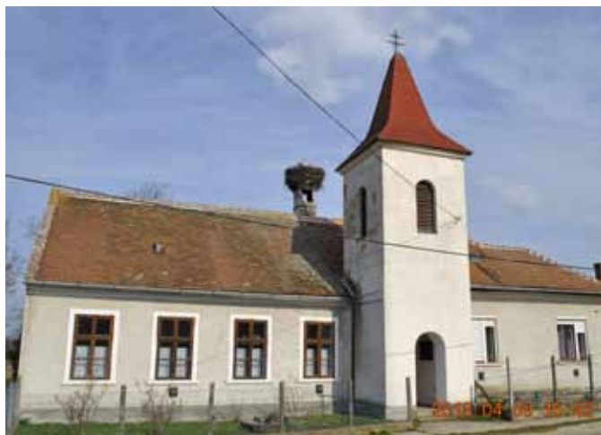
A felújításra váró rábapatyi templom

Abban a világban ahol igyekeznek kihasználni hitünket, szeretetünket, az értékeinket.