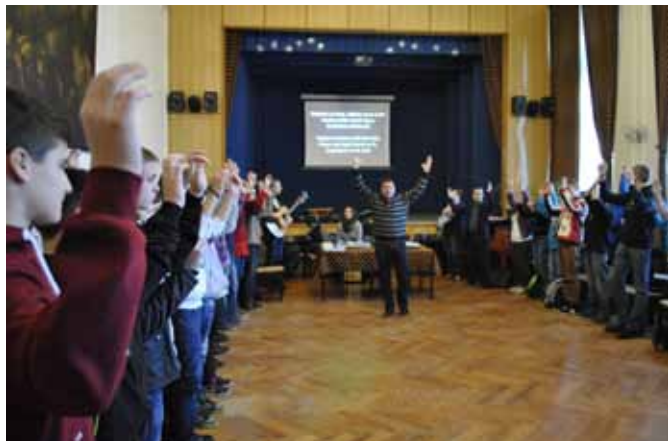
A díszteremben sokat énekeltek

nál. Végül is rájöttünk, hogy Jézus az a személy, akire mind- ez jól illik. Ezek után ismét szünet következett, majd kedvünk szerint választani lehetett, a focizás és a kézműveskedés között. A fiúk többsége a focizást választotta, ami a sárváriaknak nagyon jól ment. A lányok pedig a kézműves foglalkozáson ígés lapokat készítettek, amiket a nap végén osztottak ki. Délben az iskola megvendégtelt minket ebéddel, ami nagyon ízletes volt. Ebéd után visszamentünk a termünkbe ahol a ve-