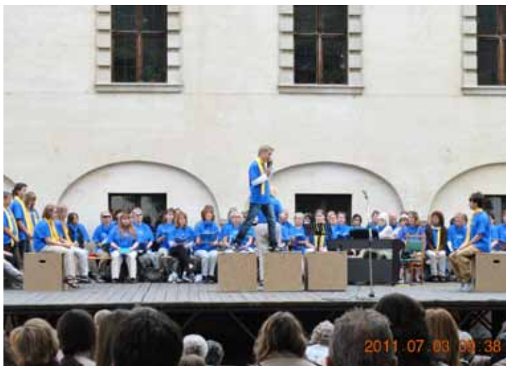
A 2011. évi előadás a vár színpadán

A próbákkal párhuzamosan sor kerülne még kis csoportos látogatásokra, házi biblia órákra.