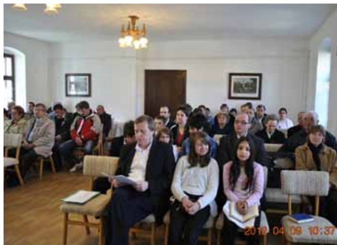
Ünnepi gyülekezet a rábapatyi templomunkban

Karácsonykor elindul megújított gyülekezeti honlapunk, ahol gyülekezetünk tagjai, és minden érdeklődő, aktuális információkat olvashat a nálunk folyó egyházi életről. Kérem, hogy egyre többen „klikkeljenek” ránk, mert rólunk szól: church.lutheran.hu/sarvar/