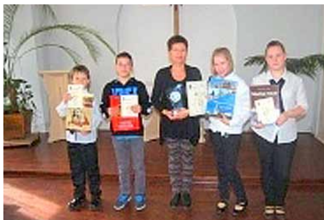
A győztes sárvári csapat és felkészítő tanáruk

Egyszerű, kézenfekvő és természetes volt a válasz, csak a hívó szót kellett meghallanom. Egész életemben gyermekekkel foglalkoztam, és most is azt tehetem, csak nagyobbakkal! Láthatom tekintetükben a csodát, amely nem a mese, hanem az igazság története, amely egész életüket megváltoztathatja, jobbra válhatnak általa. Ezt az igazságot adhatom a gyerekeknek, Isten igazságát. Ennél nehezebb, de szebb feladatot nem is kaphattam volna! És kitől? Isten mutatta meg számomra az utat, ame-