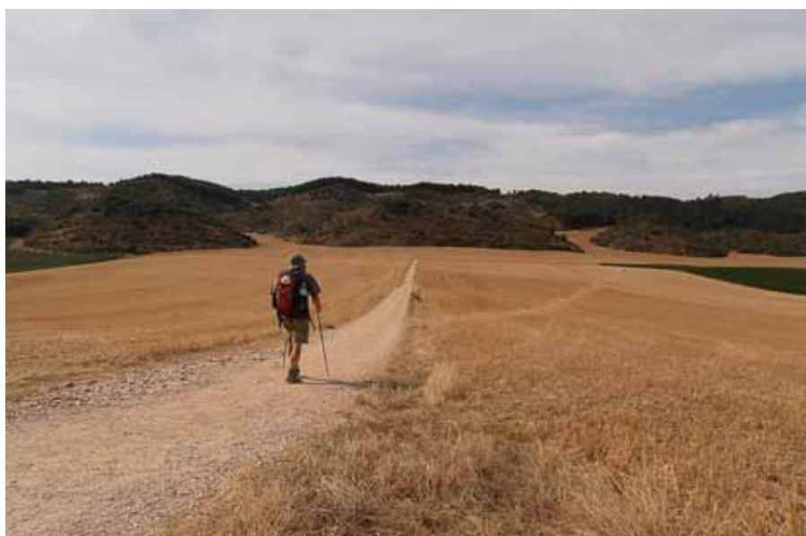
Zarándok a végtelen Mezetán

Buen Camino! - Jó Utat Mindenkinek! (Folytatása következik)